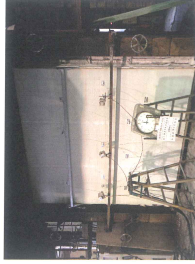
防火構造性能評価試験の様子 (30分間加熱でも裏面は全く変化がない)