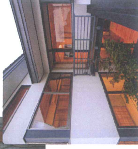
瀬戸漆喰の防火構造外壁

※防火構造仕様は、瀬戸漆喰の塗り厚、木ずり板寸法、断熱材仕様 (商品名: ウールプレス) など詳細に規定されています。必ず弊社が提供する大臣認定書類を参照の上、施工下さい。